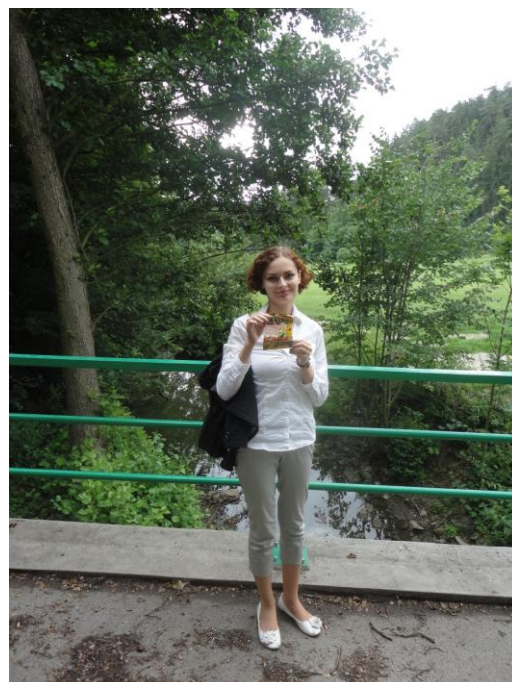
Vycházka ke Dni gumových medvídků