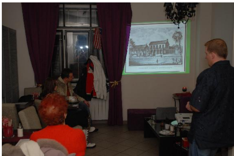
Cestovatelská přednáška v Café Bayerova