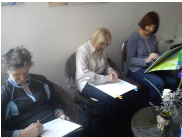
Kreslení pro radost