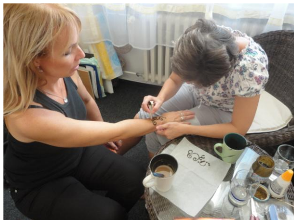
Výtvarný workshop – Malování hennou