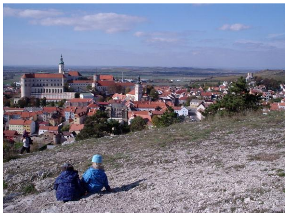
Výlet do Mikulova

Byly to výlety pro členy se zajištěním individuální péče certifikovaného průvodce.