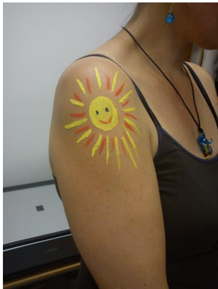
Workshop Malování na tělo

Uskutečnily se 3 výtvarné workshopy (Valentýnky, Malování na tělo, Vánoční workshop).